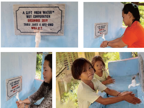
ソルソゴン州マトノグ町ツガス村 ツガス小学校へ簡易水道システムを寄贈

アジア協会アジア友の会を通じて、売上の一部でフィリピンの学校へ井戸を寄贈しました