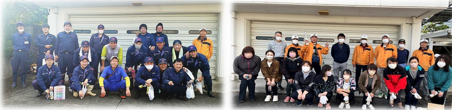
男性と女性の終了時間が違ったため、集合写真が別々になっちゃいました 《 残念(´_`) 》