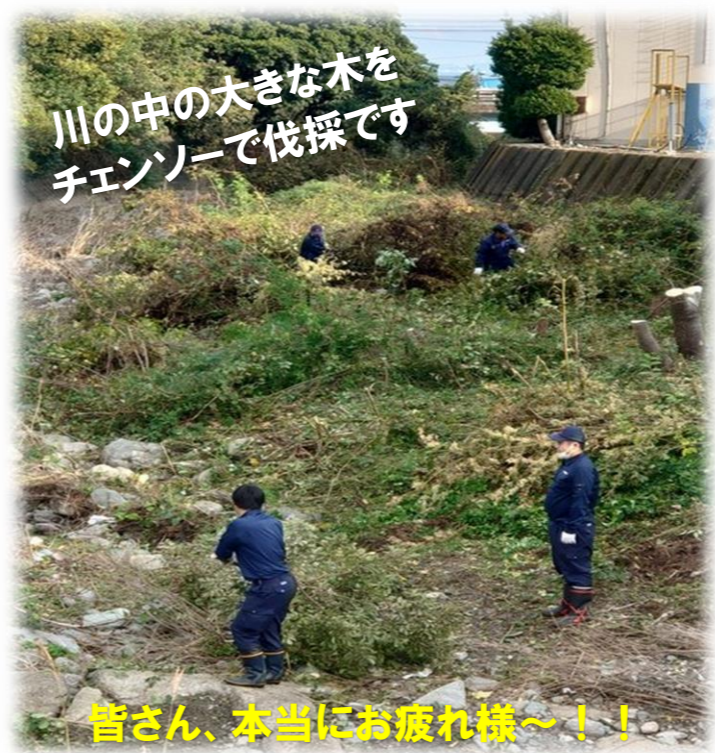
川の中の大きな木をチェーンソーで伐採です