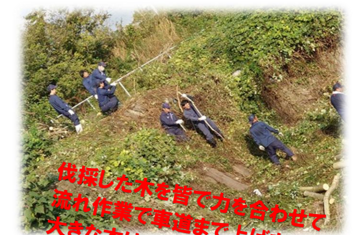
伐採した木を皆で力を合わせて流れ作業で車道まで上げます。大きな木は直径25～30cm！これは重かった～！！