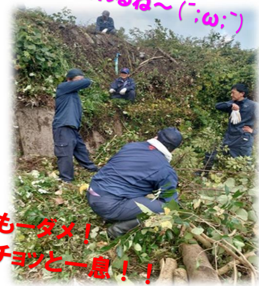
もーダメ！チョンと一息！！