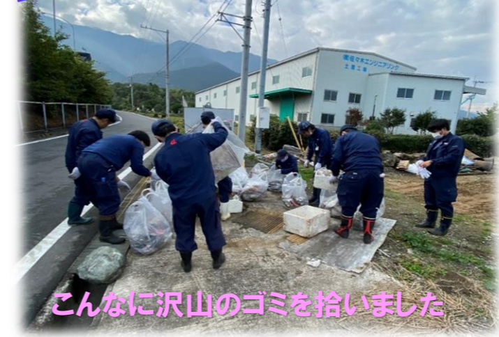
こんなに沢山のゴミを拾いました