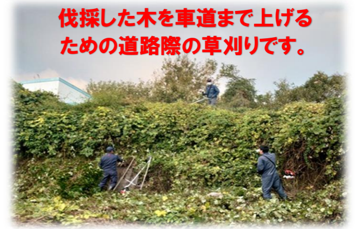
伐採した木を車道まで上げるための道路際の草刈りです。